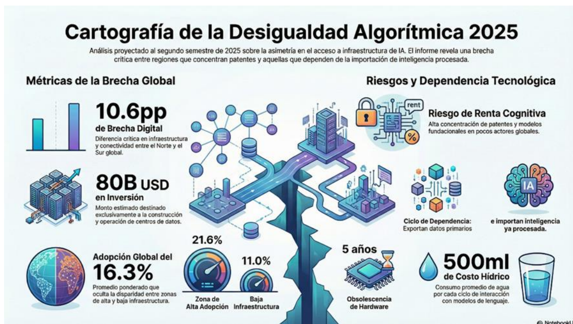
Cartografía de la desigualdad algorítmica 2025

Nota. Elaborada mediante el procesamiento de datos del informe Global AI Adoption in 2025 (AI Economy Institute) con asistencia de NotebookLM .